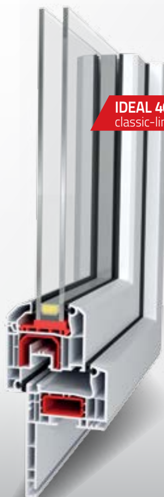
IDEAL 4000® classic-line

Avec ce type de pose, on évite le danger d'endommager les murs de l'immeuble, on gagne du temps et les travaux de finition ne sont pas nécessaires.